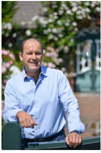
Objekt ID: 82479